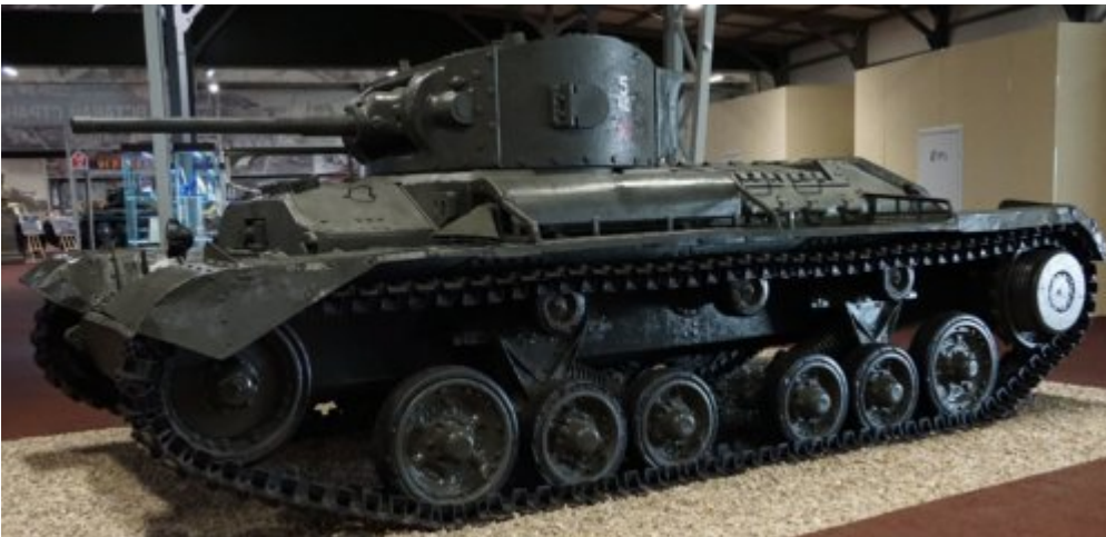
Mk III « Valentine II »