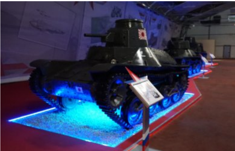
Type 95 Ha-Gō