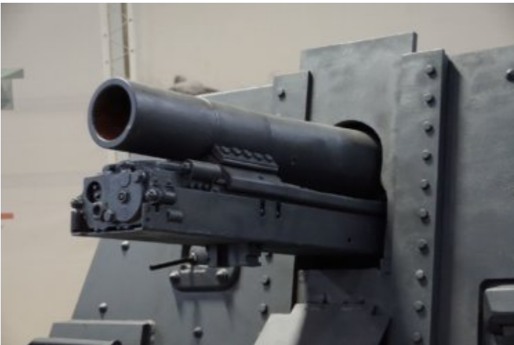
StuG 33 B