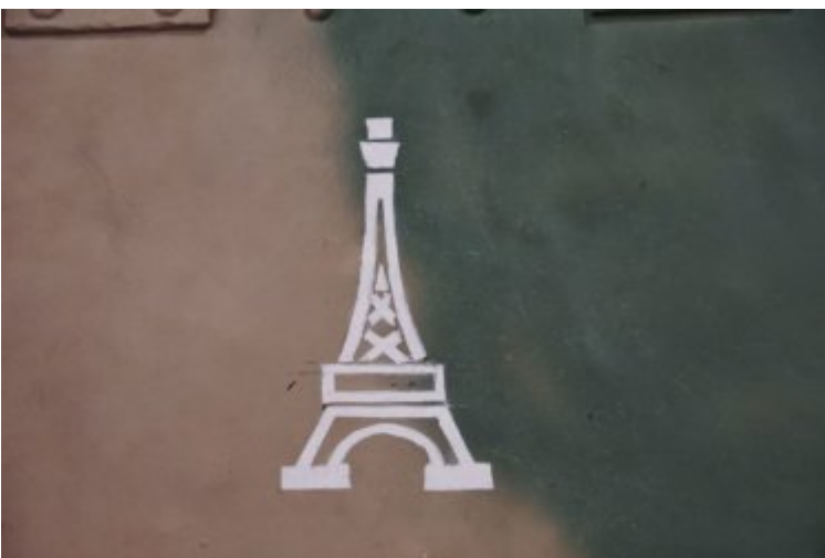
PZ KPFW IV (gros plan)