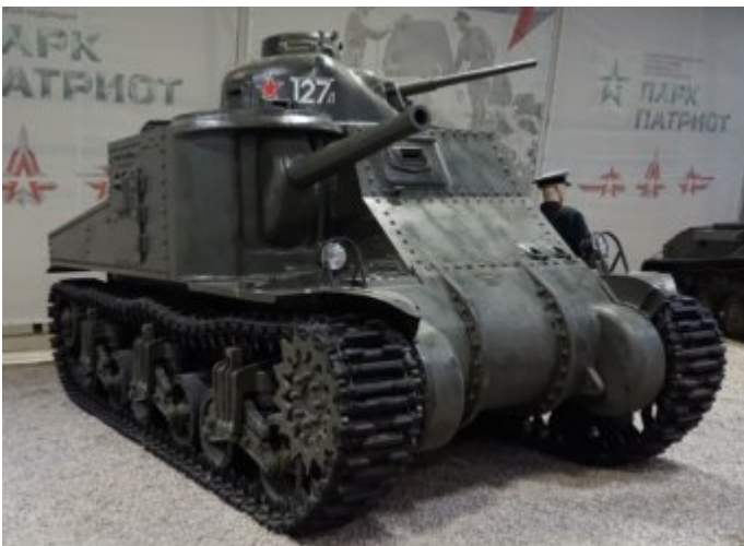
M3 « General Lee »