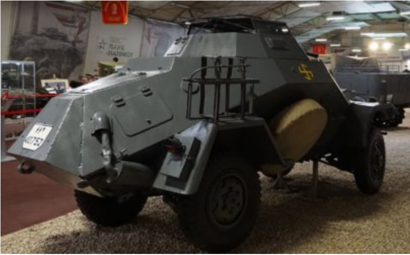
Sd Kfz 222