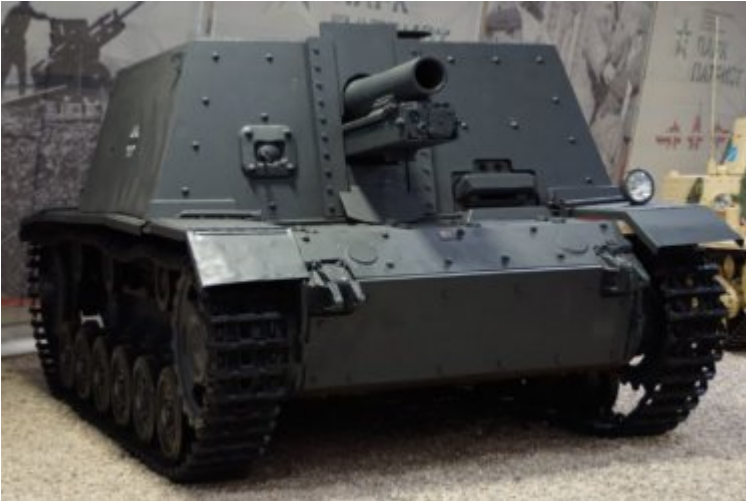
StuG 33 B