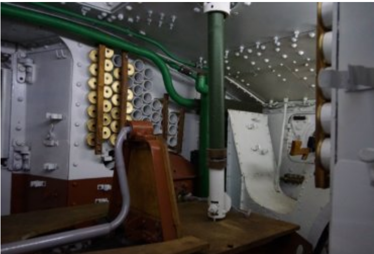
Mk V - Intérieur