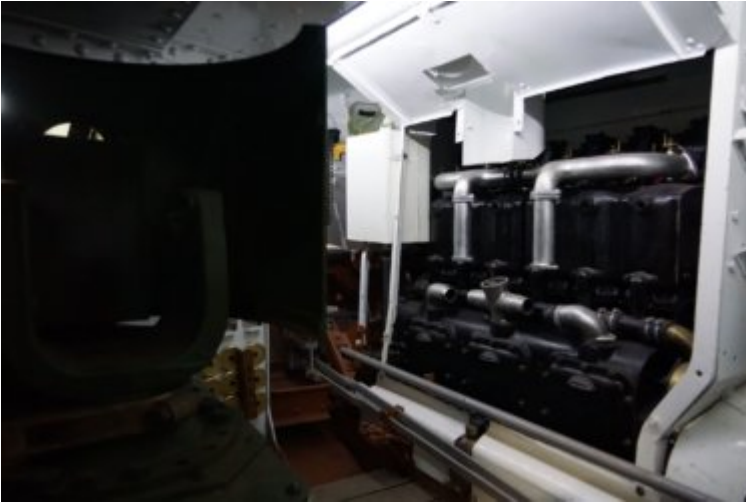
Mk V - Intérieur