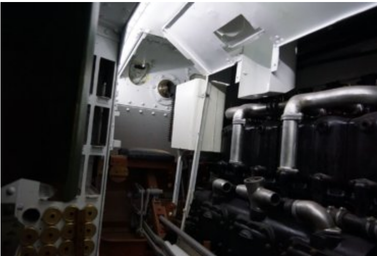
Mk V - Intérieur