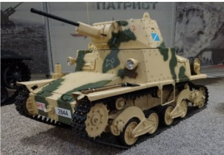
FIAT ANSALDO L6-40