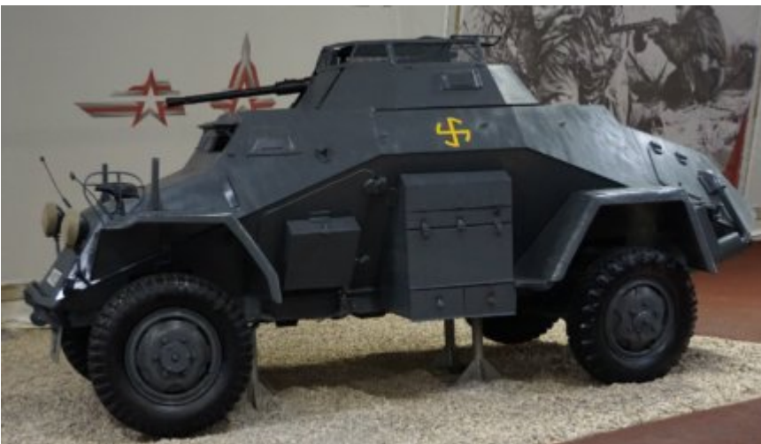
Sd Kfz 222