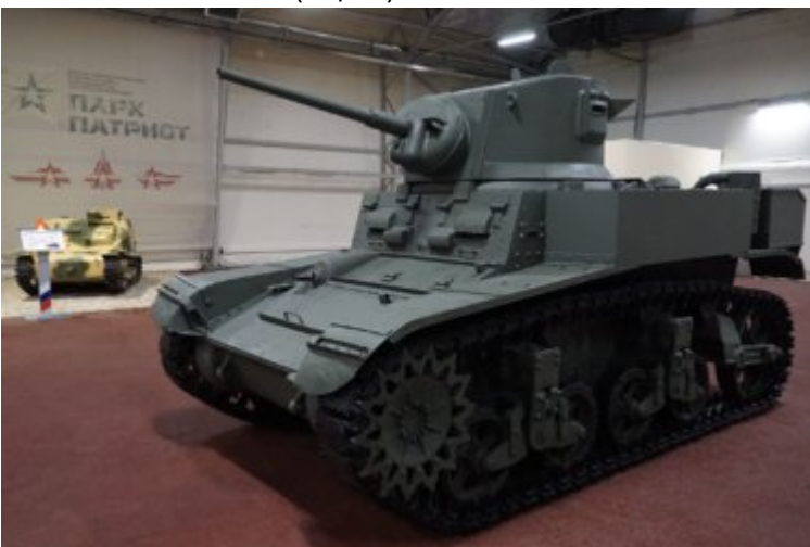
M3A1 Stuart III