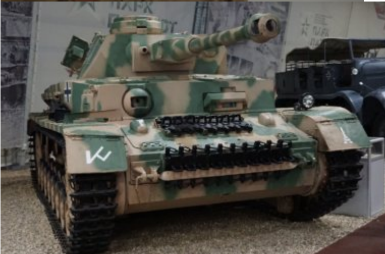
PZ KPFW IV