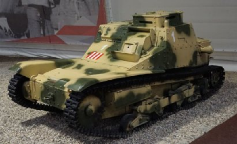
Carro Veloce CV-35 (L3/35)