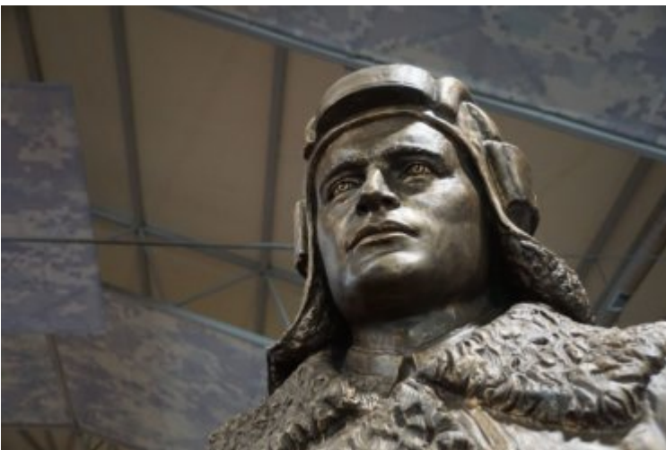
Lieutenant tankiste et chef de char Dmitri Lavrinenko. Il détruisit 52 chars en 28 combats. Il