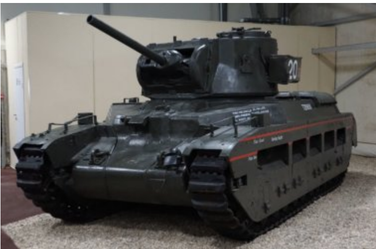
Mk II « Matilda III »