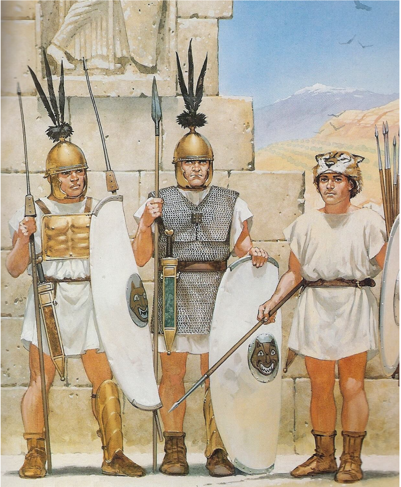
Hastati, triaire et vélite