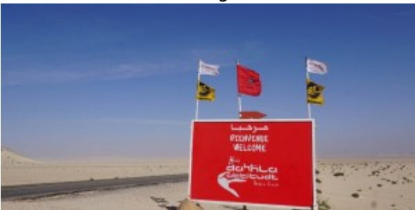
Une des stations balnéaires accueillant des adeptes du kitesurf dans le Sahara marocain.