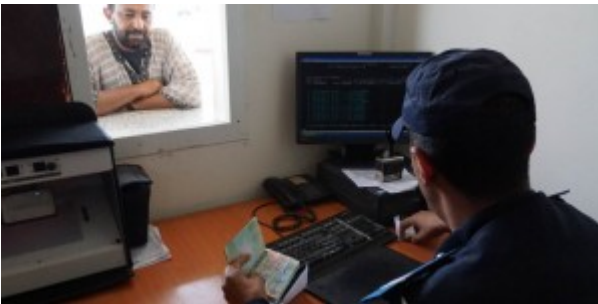
Contrôle des passeport au poste frontière de Guerguerat / Bir Guendouz entre la Mauritanie et le Maroc.

(2) Dakhla a été l'une des étapes de l'Aéropostale, sur la ligne Toulouse - Saint-Louis du Sénégal, où de grands pilotes français firent escale : Antoine de Saint-Exupéry, Jean Mermoz, Henri Guillaumet entre 1920 et 1930.