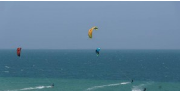
Kitesurfers dans les environs de Dakhla