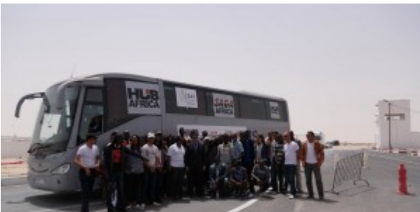
Poste frontière de Guerguerat / Bir Guendouz : un car transportant de jeunes entrepreneurs se rendant au salon HUB Africa.