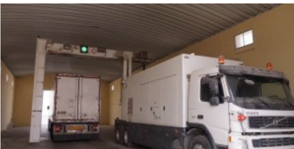
Poste frontière de Guerguerat / Bir Guendouz : un des deux scanners mobiles.