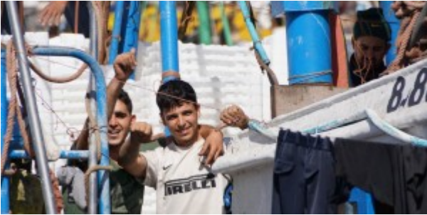
Jeunes marins pêcheurs