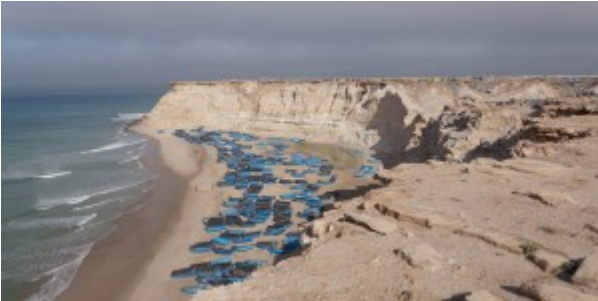
Futur site du projet portuaire Dakhla Atlantique