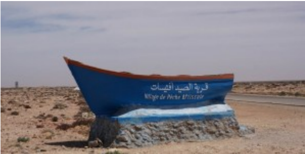
Entrée d'un village de pêcheurs artisanaux