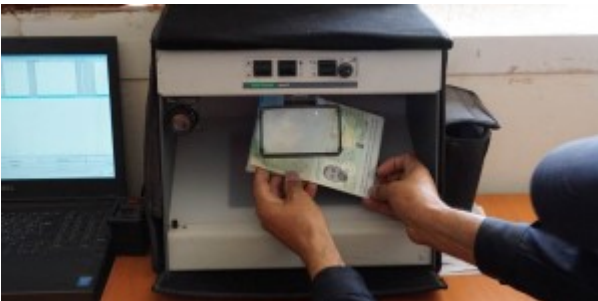
Contrôle des passeport au poste frontière de Guerguerat / Bir Guendouz entre la Mauritanie et le Maroc.