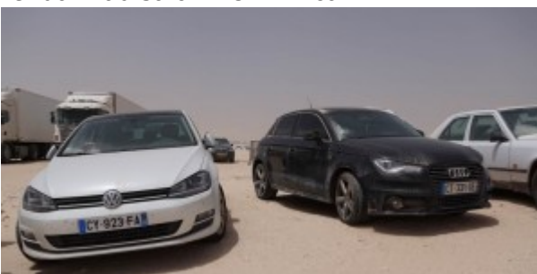
Poste frontière de Guerguerat / Bir Guendouz : Voitures françaises volées interceptées par la douane marocaine.