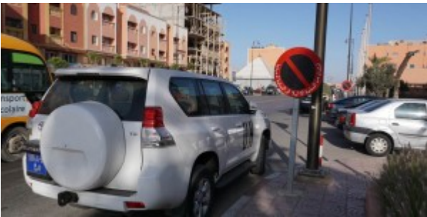
Un des 4X4 de la Minurso dans la ville de Laayoune