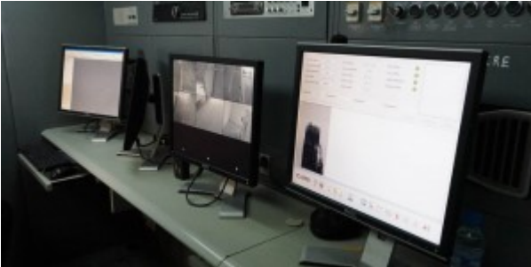
Poste frontière de Guerguerat / Bir Guendouz : à l'intérieur d'un des deux scanners mobiles.