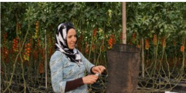
Employée dans une exploitation franco-marocaine de tomates cerises à Dakhla