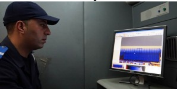
Poste frontière de Guerguerat / Bir Guendouz : Contrôle d'un camion dans un des deux scanners mobiles.