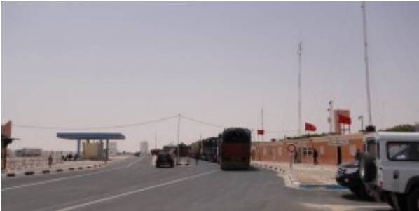
Poste frontière de Guerguerat / Bir Guendouz : File de camions se dirigeant vers la Mauritanie.