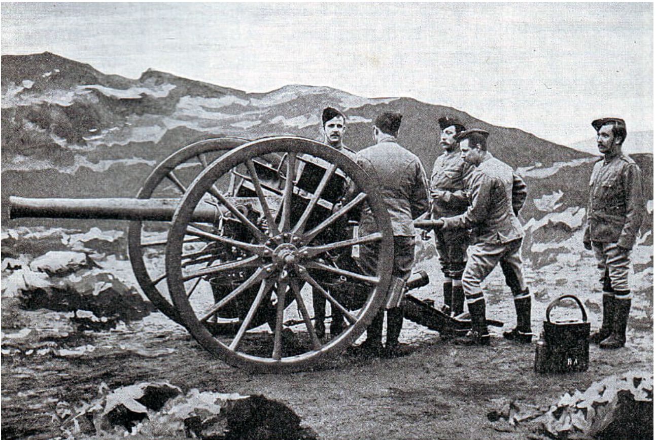
Canon de campagne britannique de 15-pdr.